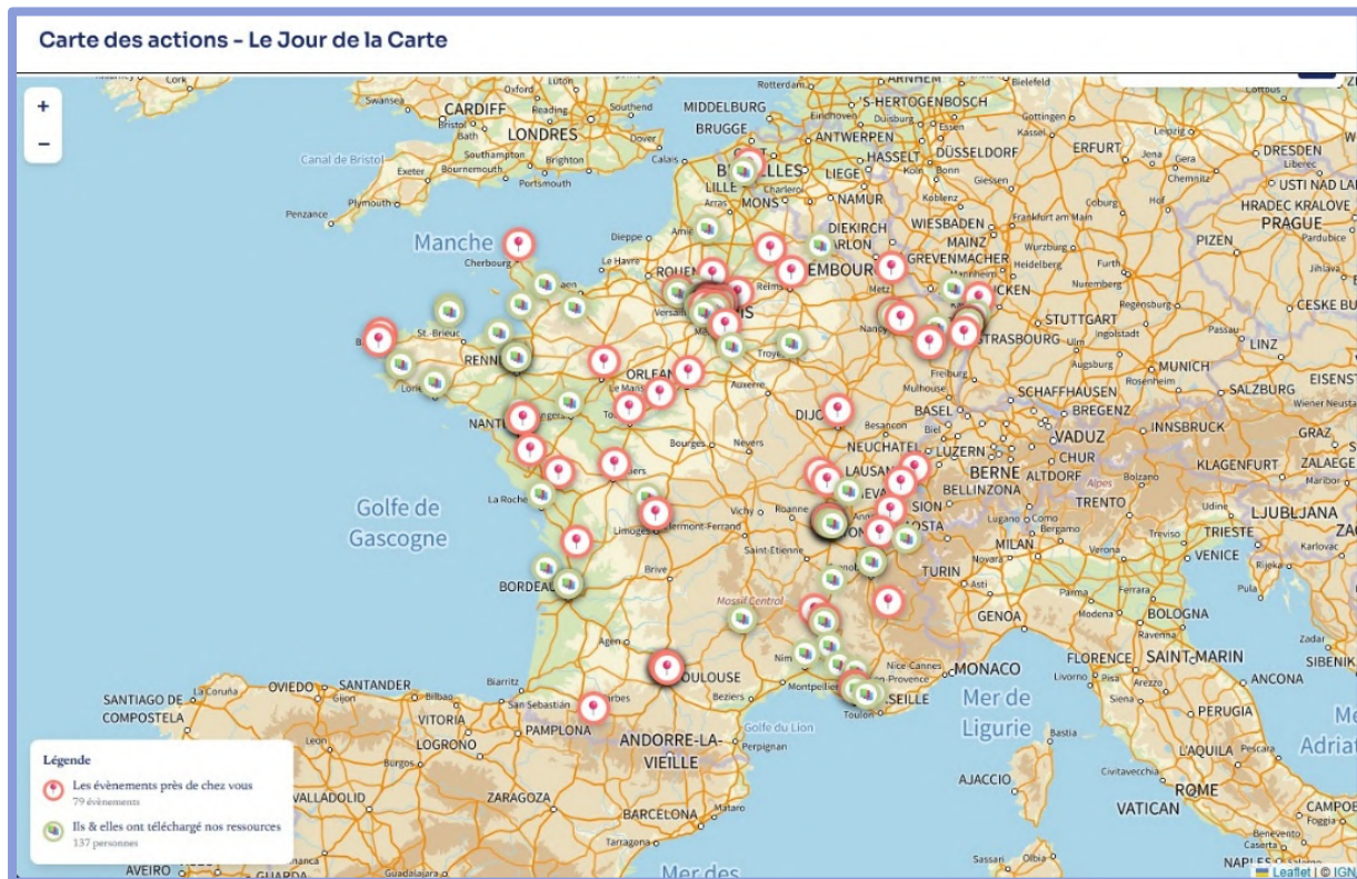
Capture d'écran de la carte des actions du Jour de la carte

Tous les événements sont à retrouver sur le site de la République des Cartes .